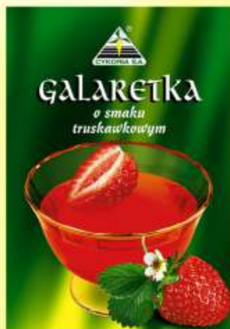
▶ o smaku truskawkowym (90 g)