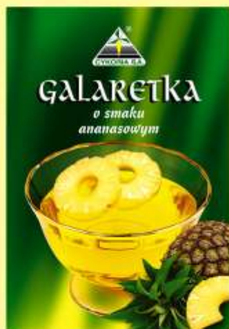
▶ o smaku ananasowym (90 g)