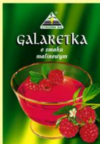
▶ o smaku malinowym (90 g)