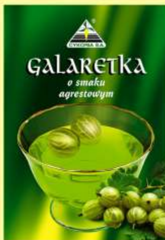
▶ o smaku agrestowym (90 g)