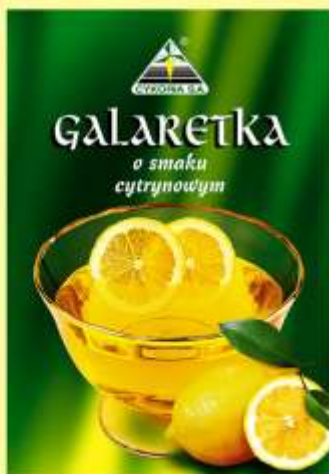
▶ o smaku cytrynowym (90 g)