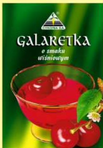
▶ o smaku wiśniowym (90 g)