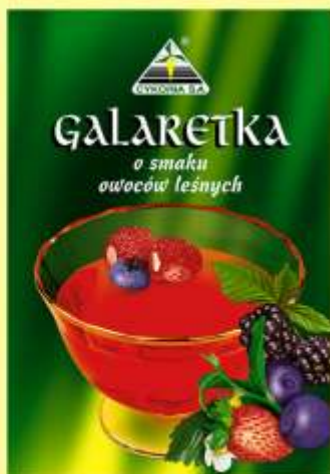
▶ o smaku owoców leśnych (90 g)