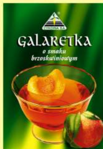
▶ o smaku brzoskwiniowym (90 g)