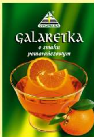
▶ o smaku pomarańczowym (90 g)