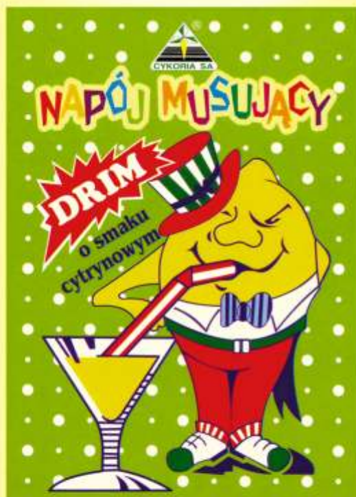
▶ o smaku cytrynowym (15 g)