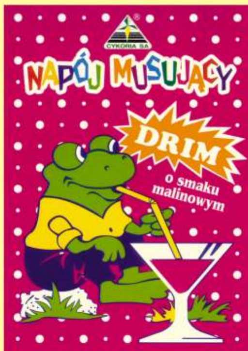
▶ o smaku malinowym (15 g)